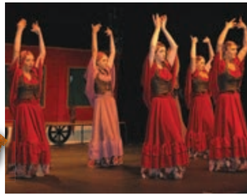
Le spectacle du C.C.L.O., le 7 juin, à l'Espace horizon.