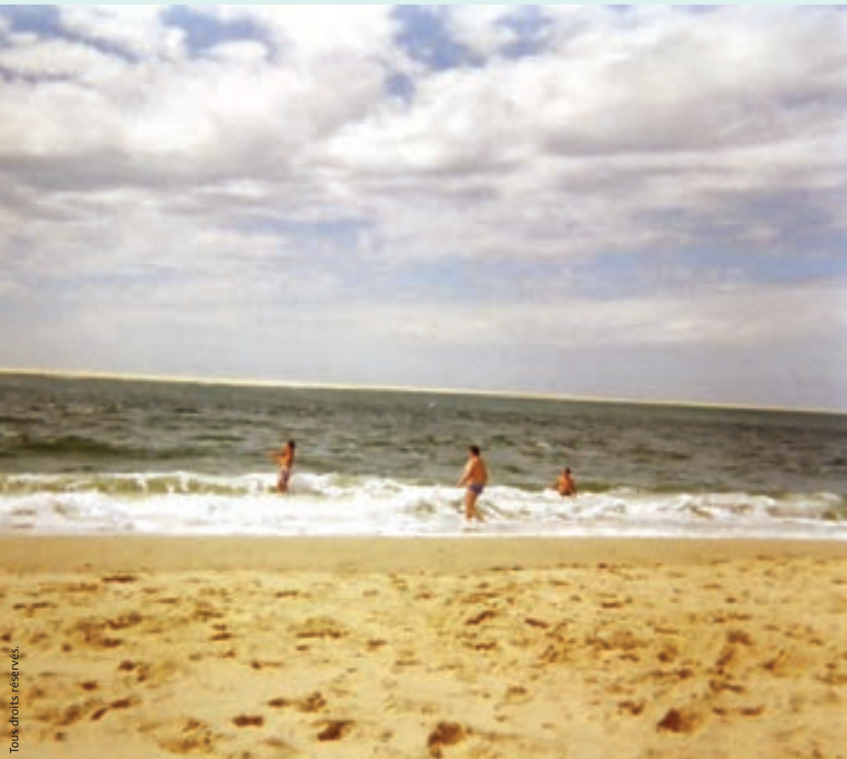
Tous droits réservés.