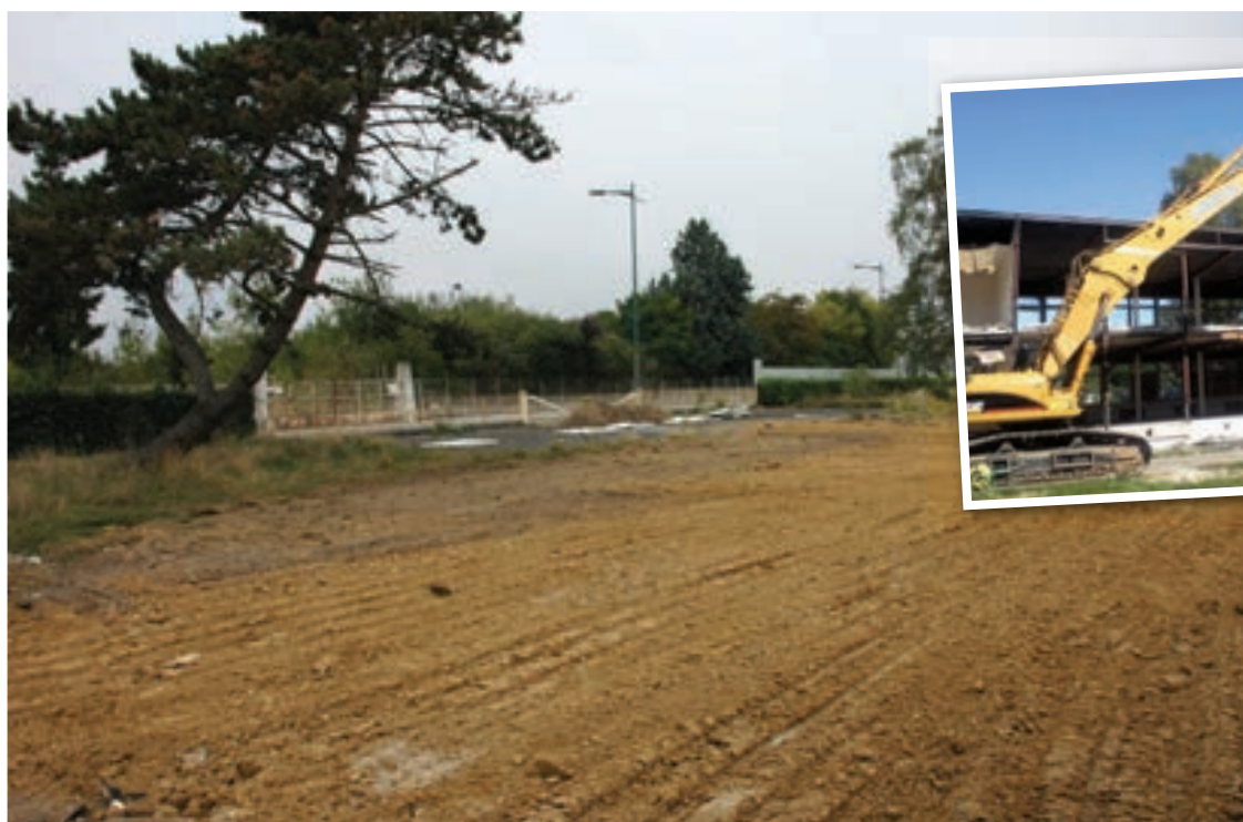
Ci-dessus, les travaux de démolition du bâtiment. Ci-contre, le terrain Diversey remis en état.