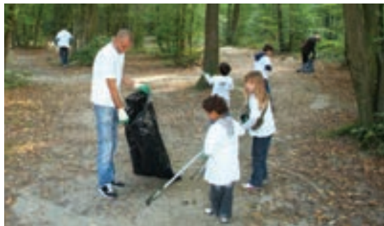
Les nettoyeurs en action dans le Bois des Charmes.

Cette année, l'opération Nettoyons la Nature a été organisée avec les riverains. En effet, lors des réunions de quartiers, certains habitants avaient souhaité améliorer les abords des bois jouxtant leur résidence. Des Ozoiens, petits et grands, nous ont accompagnés au bois des Charmes et au bois Prieur. Forte de ce succès, la Municipalité renouvellera cette opération l'année prochaine.