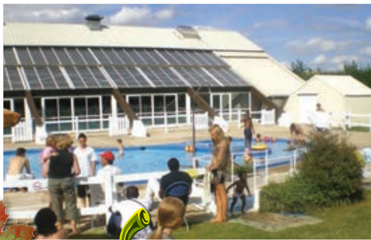
Relocalisation réussie pour l'opération Les pieds dans le sable, auprès de la piscine Catherine Plewinski.