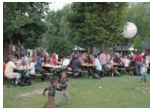
Le 13 juin, le barbecue au parc Oudry a fait le bonheur de nombreux Ozoiens.