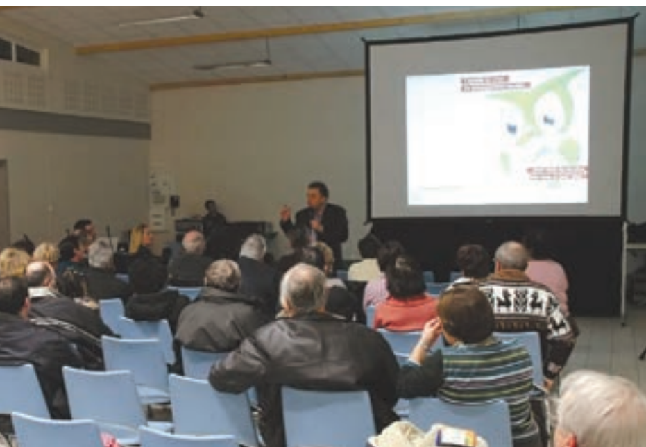
L'une des réunions des ateliers de l'Agenda 21, salle Acapulco.

Le développement durable n'est pas uniquement la protection de l'environnement, comme il est largement entendu. Il s'agit d'un processus qui concilie à la fois l'environnement, l'économie et le social, et s'efforce d'établir un cercle vertueux entre ces trois sphères.