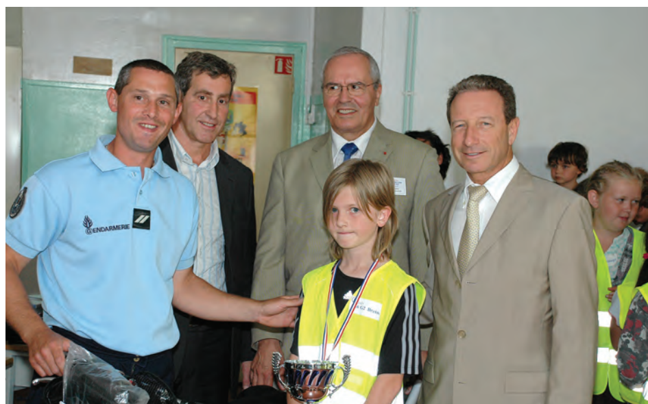
La prévention routière est l'un des axes de la politique de sécurité. Ci-dessus, la remise des prix du challenge départemental de la prévention routière, le 16 juin à l'école du Plume Vert.